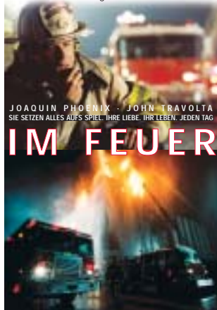
JOAQUIN PHOENIX · JOHN TRAVOLTA SIE SETZEN ALLES AUF SIEB. IHRE LIEBE. IHR LEBEN. JEDEN TAG.

Ein Helden-Epos, ganz wie es Hollywood- und Actionfans mögen. Sentimentales, Freundschaft, Spannung und eine überzeugende schauspielerische Darstellung. Die Mannschaft von „Ladder 49“ wird durchaus realistisch in Szene gesetzt.