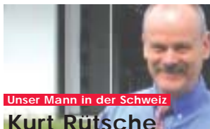
Unser Mann in der Schweiz

Mit diesem Auftrag erhöht INTERSPIRO ihre Präsenz in Texas und kann außerdem die Gelegenheit nutzen, den Kundenstamm im Südwesten der USA – wo übrigens das größte Wachstum der USA zu verzeichnen ist - zu erweitern. Nun haben wir San Antonio und Las Vegas/Clark County als „Schlüsselkunden“ in dieser Region.