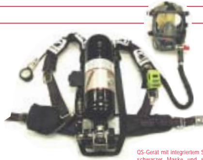
OS-Gerät mit integriertem SuperPass, schwarzer Maske und schwarzem Lungenautomaten sowie integriertem Quickkillsystem