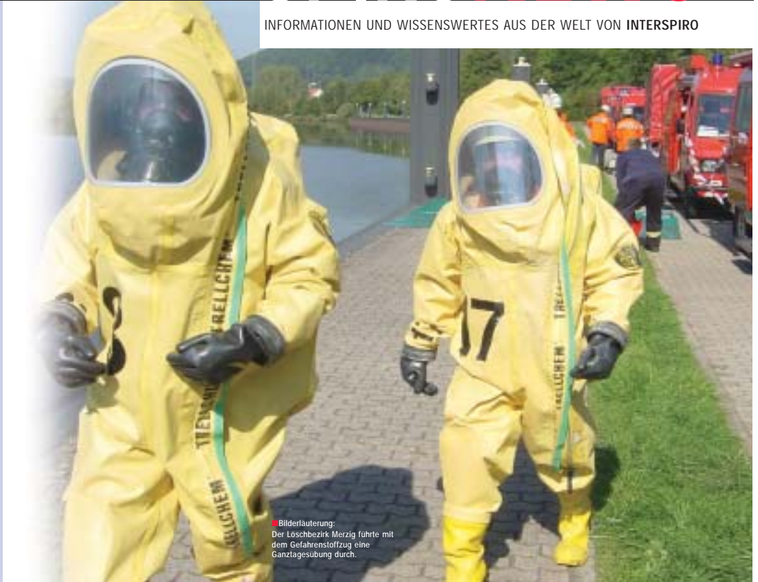
■ Bilderfäuterung: Der Löschbezirk Merzig führte mit dem Gefahrenstoffzug eine Ganztagesübung durch.