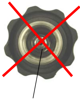
Schwarzer Stutzen-O-Ring P/N 336-190-437 10er Pack